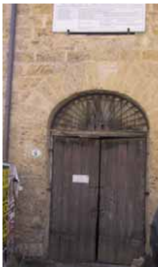
CENTRO DIURNO "GIOVANNI PAOLO II"