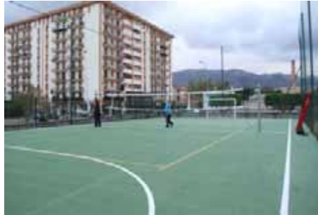
CAMPO DI CALCIO 3P