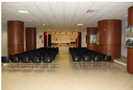
AUDITORIUM COMUNALE "G. DI MATTEO"