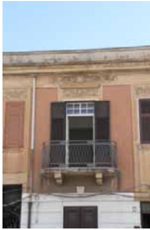
CENTRO DI ACCOGLIENZA "EMMANUEL"